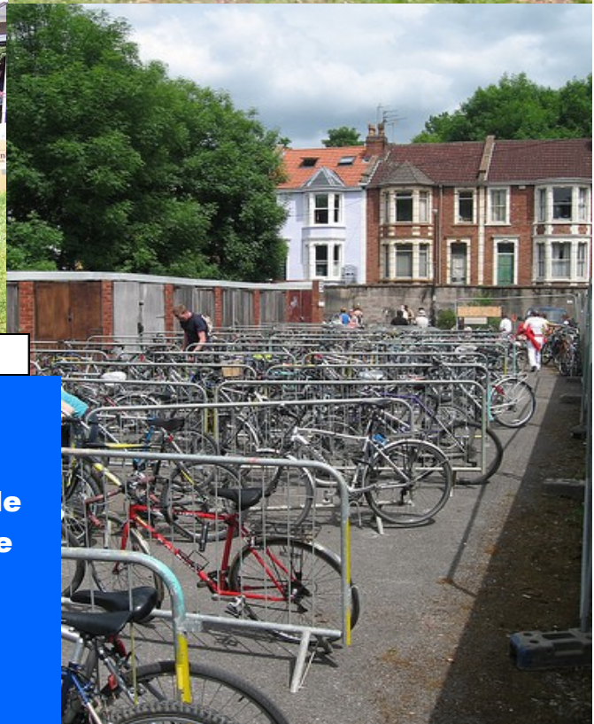
Parking pour les bicyclettes à un marché