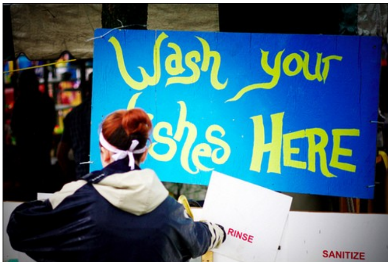
Festival Hillside : Poste de lavage de vaisselle: Photo : Chris Tiesse