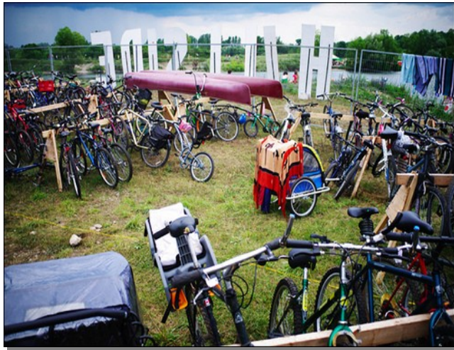
Supports à vélos de fabrication artisanale et enclos supervisé, Festival Hillside