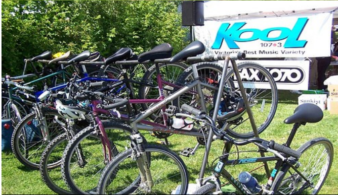
Accueillez un festival neutre de Carbone