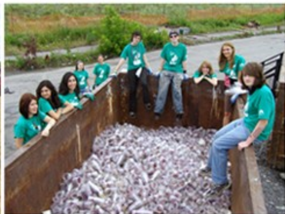
Festival Hillside : Réduire, réutiliser, recycler